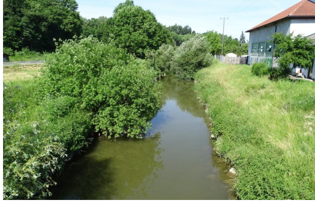
Abbildung 10. Untersuchungsstrecke A, Blick flussauf.

Figure 9. Stretch A, looking upstream. 17-vi-2016, Photo: A. Chovanec.