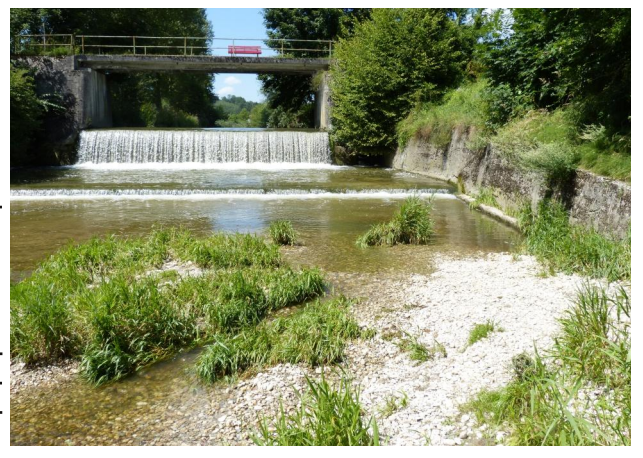
Abbildung 16. In eine aufgelöste Rampe umgebaute Hammermühlstufe, Blick flussauf. Figure 16. Fish-pass-

Figure 15. The not fishpassable artificial fall "Hammermühlstufe" before the conversion into a fish-passable river rock-ramp, looking upstream. 30-vii-2016, Photo A. Chovanec.