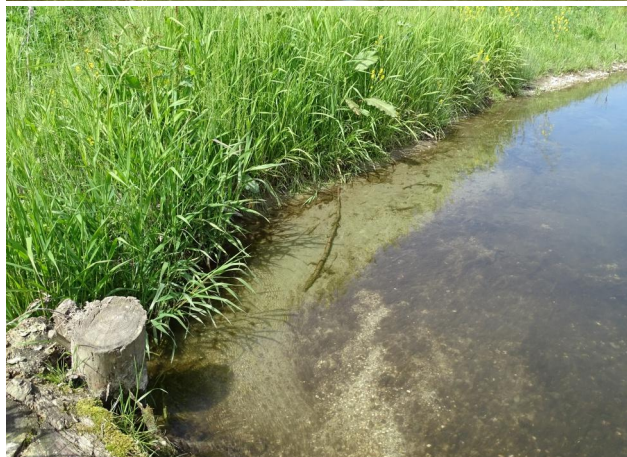
Abbildung 7. Strömungsberuhigter Uferbereich mit Ablagerungen von Detritus, Sand und Feinkies.

Figure 6. Narrow river bed in stretch B with higher flow velocity. 16-vi-2021, Photo: A. Chovanec.