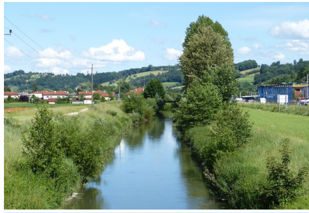
Abbildung 11. Untersuchungsstrecke B, Blick flussab.

Figure 11. Stretch B, looking downstream. 17-vi-2016, Photo: A. Chovanec.