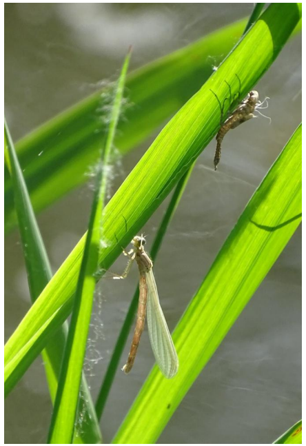
Abbildung 23: Frisch emergiertes Weibchen von Platycnemis pennipes .

Figure 22. Male Onychogomphus forcipatus. 15-viii-2021, Photo: A. Chovanec.