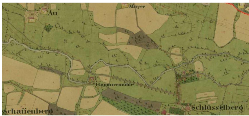
Abbildung 1. Gewunden-/mäandrierender Verlauf der Trattnach im 19. Jahrhundert vor der Durchführung umfassender Regulierungen. – Figure 1. Wandering /meandering course of the River Trattnach in the 19th century before the implementation of large-scale regulation. (Quelle/Source: https://maps.arcanum.com/de/map).

Der kartierte Flussabschnitt (oberstromiger Beginn Länge: 13°51′23′′, Breite: 48°13′17′′; unterstromiges Ende Länge: 13°51′54′′, Breite: 48°13′13′′) liegt in der Marktgemeinde Schlüßlberg / Ortschaft Au (Bezirk Grieskirchen), erstreckt sich über eine Länge von etwa 500 m und liegt auf einer Seehöhe von 325 m ü. NN. Das Einzugsgebiet der Trattnach weist in diesem Bereich eine Größe von 165 km² auf. Basierend auf den Kriterien Bioregion, Höhenlage und Einzugsgebietsgröße ist die Trattnach im untersuchten Bereich dem Gewässertyp "11-2-3" (Wimmer et al., 2007; Wimmer & Wintersberger, 2009) zuzuordnen, der wie folgt zu charakterisieren ist: Die prägenden morphologischen Strukturen sind Steil- und Flachufer, unterspülte Anbruchufer mit Totholz und Wurzelstöcken, Kiesund Sandbänke; die Breiten- und Tiefenvariabilität des Gewässerbettes sind hoch. Die Gewässersohle wird dominiert von unterschiedlichen Kiesfraktionen mit Steinanteilen, in Uferbereichen kommt es zu Sand- und Schluffablagerungen. Das Gefälle ist mittel