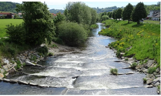
Abbildung 18. Untersuchungsstrecke D, Blick flussab von der kleinen Brücke über die aufgelöste Rampe. Figure 18. Stretch D, looking downstream from the small bridge over the fish-passable rock-ramp. 26-v-2021, Photo: A. Chovanec.

Abbildung 17. Untersuchungsstrecke D, Blick flussab von der Hammermühlstufe. Figure 17. Stretch D, looking downstream from the artificial fall "Hammermühlstufe." 30-vii-2016, Photo: A. Chovanec.