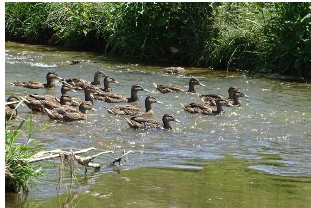
Abbildung 6. Schmälerer Flussbereich in Untersuchungsstrecke B mit höherer Strömungsgeschwindigkeit.

Figure 6. Narrow river bed in stretch B with higher flow velocity. 16-vi-2021, Photo: A. Chovanec.