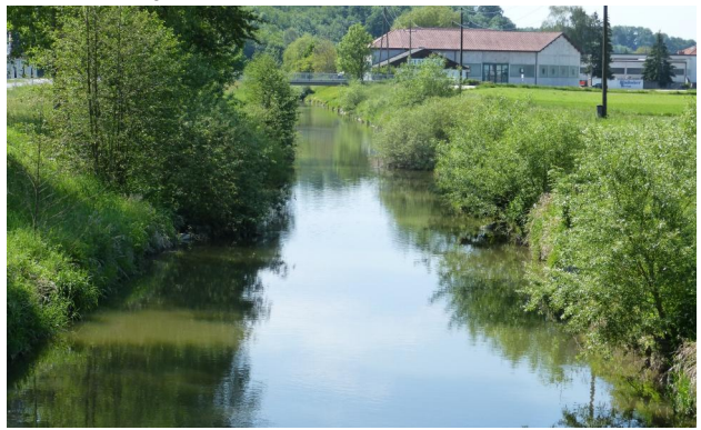
Abbildung 13. Untersuchungsstrecke C Blick flussauf von der Hammermühlstufe.

Figure 13. Stretch C, looking upstream from the weir "Hammermühlstufe". 28-v-2016, Photo: A. Chovanec.