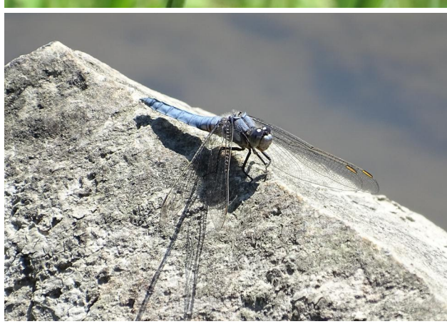
Abbildung 27. Männchen von Orthetrum brunneum, Strecke B. Figure 27. Male Orthetrum brunneum, stretch B. 16-vi-2021, Photo: A. Chovanec.

Abbildung 26. Frisch emergiertes Männchen von Onychogomphus forcipatus , Strecke B. Figure 26. Freshly emerged male of Onychogomphus forcipatus , stretch B. 16-vi-2021, Photo: A. Chovanec.