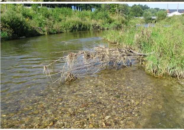
Abbildung 8. Grobkies und Steine in Untersuchungsstrecke B. Figure 8. Area with higher flow velocity and deposited mesolithal and stones. 15-viii-2021, Photo: A. Chovanec.

Figure 7. Area with reduced flow velocity and deposited detritus, sand and microlithal. 26-v-2021, Photo: A. Chovanec.