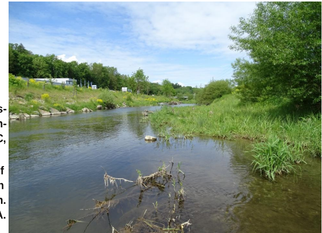
Abbildung 4. Flussbettaufweitung in Untersuchungsstrecke C, Blick flussauf.

Figure 4. Widening of the river bed in stretch C, looking upstream. 26-v-2021, Photo: A. Chovanec.