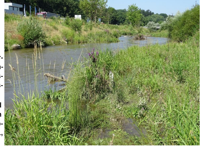
Abbildung 5. Überschwemmtes Flachufer in Untersuchungsstrecke C, Blick flussauf.

Figure 4. Widening of the river bed in stretch C, looking upstream. 26-v-2021