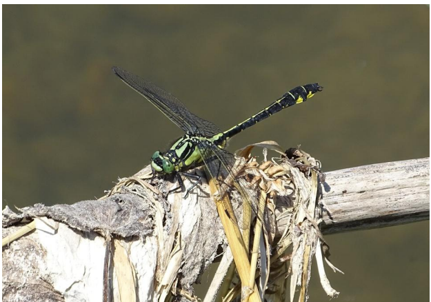
Abbildung 25. Männchen von Gomphus vulgatissimus, Strecke B.

Figure 25. Male Gomphus vulgatissimus, stretch B. 16-vi-2021, Photo: A. Chovanec.