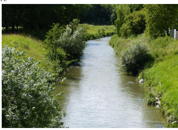
Abbildung 9. Untersuchungsstrecke A, Blick flussauf.

Figure 9. Stretch A, looking upstream. 17-vi-2016, Photo: A. Chovanec.