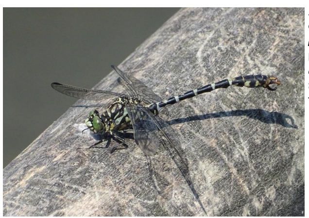
Abbildung 22. Männchen von Onychogom phus forcipatus.

Figure 22. Male Onychogomphus forcipatus. 15-viii-2021