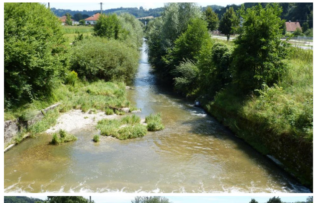
Abbildung 17. Untersuchungsstrecke D, Blick flussab von der Hammermühlstufe. Figure 17. Stretch D, looking downstream from the artificial fall "Hammermühlstufe." 30-vii-2016, Photo: A. Chovanec.