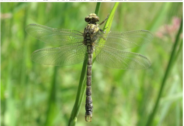
Abbildung 26. Frisch emergiertes Männchen von Onychogomphus forcipatus , Strecke B. Figure 26. Freshly emerged male of Onychogomphus forcipatus , stretch B. 16-vi-2021, Photo: A. Chovanec.

Figure 25. Male Gomphus vulgatissimus, stretch B. 16-vi-2021, Photo: A. Chovanec.