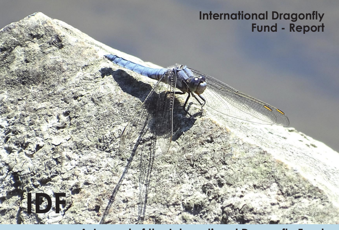
A Journal of the International Dragonfly Fund