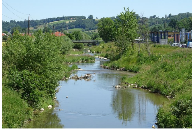
Abbildung 12. Untersuchungsstrecke B, Blick flussab.

Figure 11. Stretch B, looking downstream. 17-vi-2016, Photo: A. Chovanec.