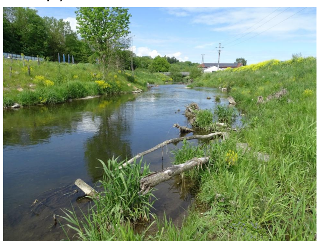
Abbildung 3. Totholz und Wurzelstockbuhnen in Untersuchungsstrecke B, Blick flussauf.

Figure 2. The investigated section of the River Trattnach before (upper picture) and after the implementation of rehabilitation measures (lower picture). The arrow indicates the flow direction; A–D: stretches investigated. (Quelle/Source: www.bing.com/maps).