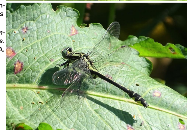
Figure 21. Male Gomphus vulgatissimus. 16-vi-2021, Photo: A. Chovanec.

Abbildung 21. Männchen von Gomphus vulgatissimus.