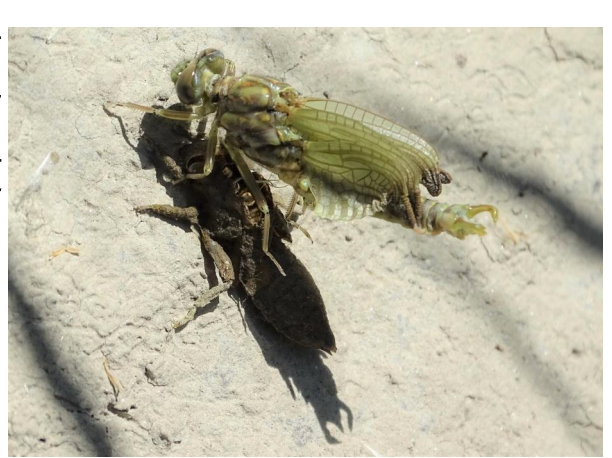
Figure 24. Freshly emerged male of Onychogomphus forcipatus , stretch A. 16-vi-2021, Photo: A. Chovanec.

Untersuchungsstrecken B – D: Wesentlichstes Ergebnis der Studie ist das bodenständige Auftreten der beiden Leitarten aus der Familie Gomphidae (Flussjungfern) G. vulgatissimus und O. forcipatus an den drei im Maßnahmenabschnitt begangenen Strecken im Jahr 2021 (Abb. 25, 26). Onychogomphus forcipatus wurde insbesondere an Strecke B in hohen Abundanzen gesichtet. Mit A. imperator und O. brunneum (Abb. 27) wurden zwei Begleitarten erster Ordnung als möglicherweise bodenständig klassifiziert. Die Zahl der gesichteten Arten erhöhte sich von fünf (2016) auf zehn (2021), jene der sicher, wahrscheinlich und möglicherweise bodenständigen Arten von vier auf acht (Tab. 7). Besonders bei den Strecken B und C sind die Verbesserungen der Fundsituationen besonders augenscheinlich (Tab. 8). Den Tabellen 9–12 sind die detaillierten begehungstermin-bezogenen Ergebnisse für das Jahr 2021 mit der Darstellung der konkreten Fundsituationen zu entnehmen.