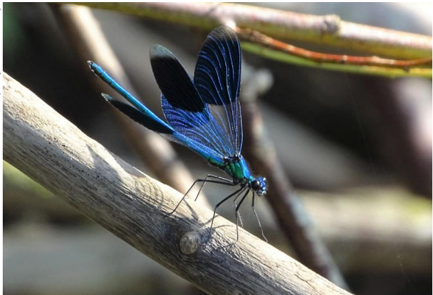
Abbildung 20. Männchen von Calopteryx virgo .

Figure 19. Male Calopteryx splendens . 15-viii-2021