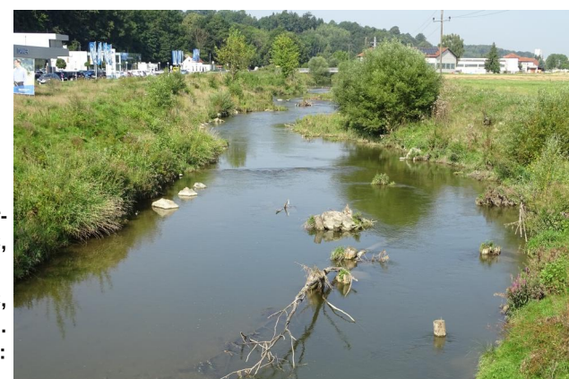
Abbildung 14. Untersuchungsstrecke C, Blick flussauf.

Figure 14. Stretch C, looking upstream. 15-viii-2021, Photo: A. Chovanec.