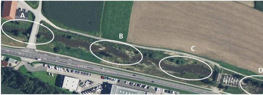
Abbildung 2. Untersuchungsabschnitt an der Trattnach in Schlüßlberg vor Durchführung der ökologischen Aufwertungsmaßnahmen (oben) und nach ihrer Fertigstellung (unten); der Pfeil zeigt die Fließrichtung an; A–D: Untersuchungsstrecken.

Figure 2. The investigated section of the River Trattnach before (upper picture) and after the implementation of rehabilitation measures (lower picture). The arrow indicates the flow direction; A–D: stretches investigated.